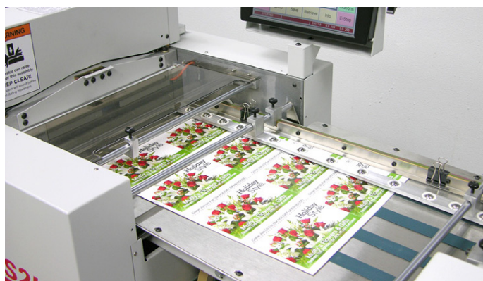
Det långa anslutningsbordet ger en mycket noggrann precision av arket till Zip-TS2L.