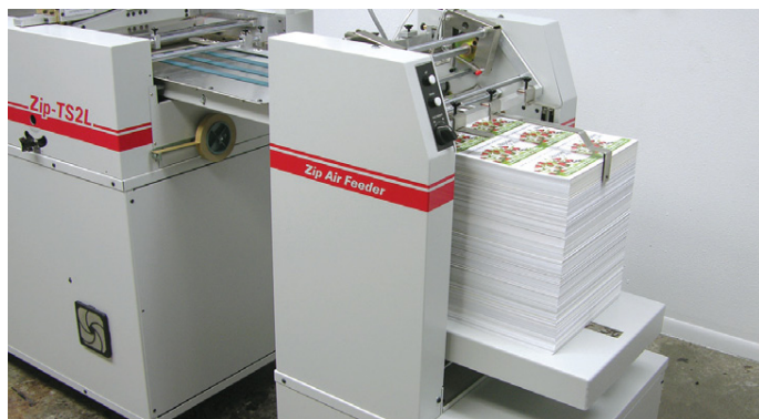
Arkmataren kan hantera ark upp till 343mm bredd.

Tillval: Streckkodsläsare finns som tillval för snabb åtkomst av tidigare programmerade arbeten.